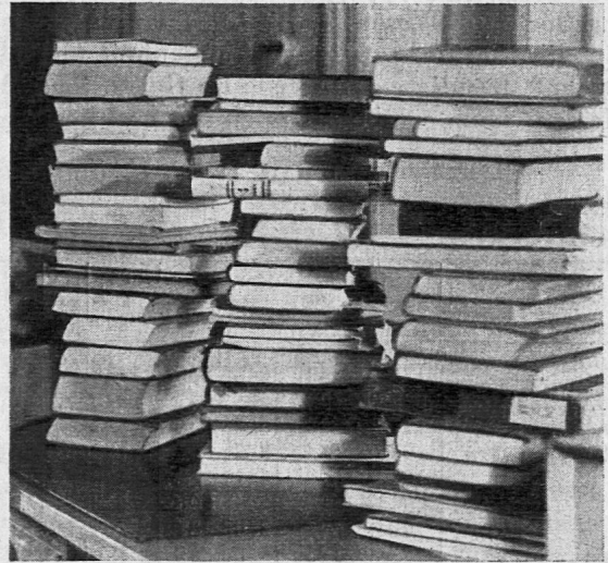
Zum Beginn des Tagewerkes im Pestalozzianum: Ausleihsendungen werden bereit gelegt.

Sicherlich liegt die Pflege solch internationaler Beziehungen im Interesse des Schweizervolkes. Dafür aber sollte der Bund die nötigen Mittel bereitstellen, statt die letzte kleine Subvention zu streichen. Es wäre im höchsten Grade bedauerlich und ein Unglück für unser Land, wenn im Bundeshaus nur noch die Machtansprüche der grossen Wirtschaftsverbände Beachtung finden würden, während stille Bildungsarbeit ohne jegliche Hilfe bleiben müsste.