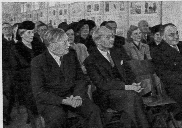
Eröffnung der Ausstellung «Neues Leben in den tschechoslowakischen Schulen».

Es zeigt sich bei solchen Ausstellungen immer wieder, dass sie besonderen Zuspruch finden, wenn sie nicht nur durch Führungen erläutert, sondern durch Vorträge, Lehrproben und Filme ergänzt werden. Im