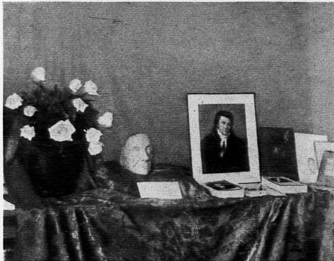
Aus einer Pestalozzi-Ausstellung in Lissabon.