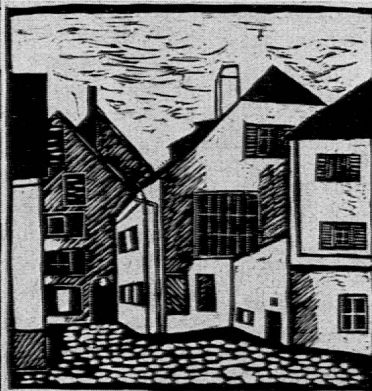
Metzgerplatz in Chur. Linolschnitt nach dem Bildausschnitt. 5. Seminarklasse, 17jährig.