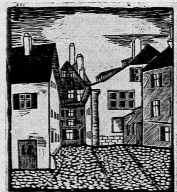
Standpunkt mehr rechts.

und weissen Flächen auch graue Wirkungen erreicht werden durch Schraffuren.