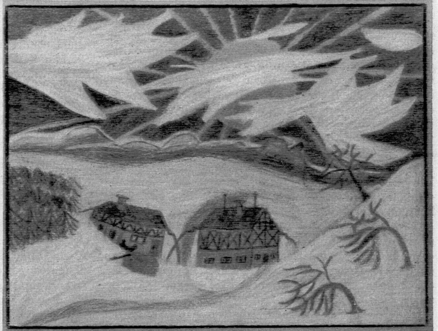
Fö h n. Farbstiftmalerei eines 9jährigen Knaben, auf grauem Grund. Format 21/28 cm. Elementarstufe Fr. E. Lenhardt, Arn/Horgen.

Diese Zeichnung zeigt das wundervolle Zusammenspiel von gefühls- und verstandesmäßigem Erfassen und Gestalten einer Realität. Die Häuser, die hier Teile eines Ganzen sind, wurden mit übersetzender Gestaltungskraft in die geschauten Einheit einbezogen. Die ganze Darstellung ist von einer bewegenden Kraft ergriffen. Wolken, Berge, Bäume und Häuser werden in diesen Rhythmus einbezogen. Das leuchtende Blau des Himmels klingt über die Landschaft nach unten aus.