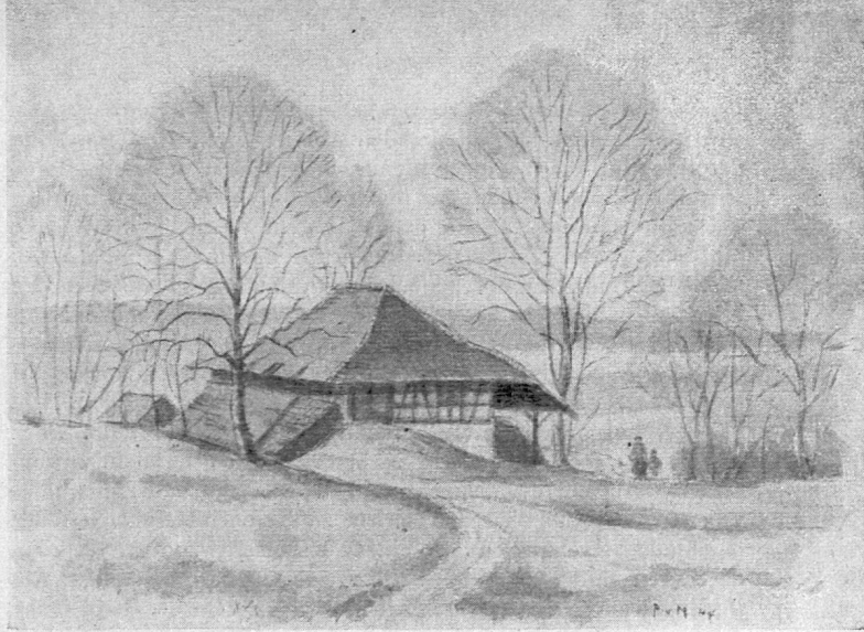
Alte Hanfribe bei Hettlingen

Schwandegg. Es weist aber auch zwei kirchliche Gebäude von kultur- und kunsthistorischem Wert auf: die Galluskapelle bei Oberstammheim und die Antoniuskapelle bei Waltalingen, am Fusse von Schwandegg. Dieser wollen die folgenden Angaben gewidmet sein.