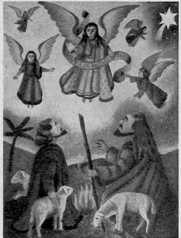
Das Vorbild der ausdrucksvollen Schülerarbeit ist eine indirekte Hilfe im Zeichenunterricht. Das wundervolle Weihnachtstitelblatt des «Schweizer-Spiegels», auch die Reproduktionen in Zeichnen und Gestalten sind geeignet, im Kind den Sinn für die Schönheit und Wahrheit im bildlichen Ausdruck zu entwickeln. Red.

Die Schüler wussten, worum es ging: es galt, ein farbiges Weihnachtsbild für den «Schweizer-Spiegel» zu erstellen. Wir besannen uns darauf, wie das Thema abgewandelt werden könnte, und fanden, dass neben den biblischen Aspekten auch andere Fassungen möglich wären: Weihnacht bei uns daheim, im Kranken-