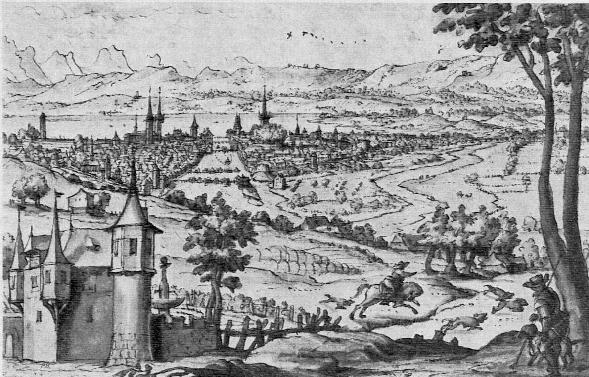
Blick vom Beckenhof auf das alte Zürich. (17. Jahrhundert. Original im Besitze des Landesmuseums)

Mit dem Ausleihdienst stehen die Auskünfte zum Teil in enger Beziehung. Zahlreich sind die Anfragen an unser Personal über geeignetes Bildermaterial oder Literatur zu speziellen Problemen, und wenn auch unsere Angestellten nicht über spezielle pädagogische