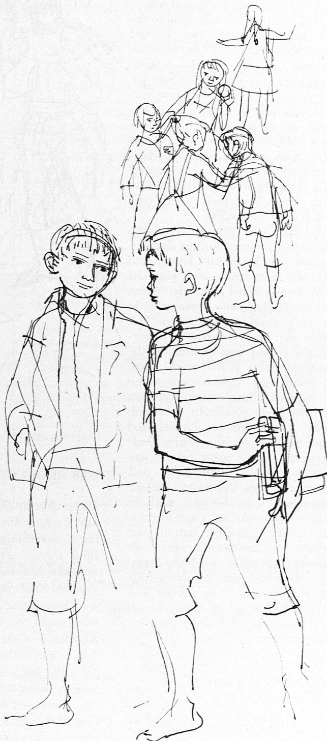
Illustration von Sita Jucker aus SJW-Heft Nr. 663 «Nur eine Katze»

Als sie die Einsamkeit nicht mehr ertrug, schlich sie doch im Dämmer des Abends aus der Burg und lief zu der Stelle, wo sie den Burschen vermutete. Und wirklich, er wartete dort seit langem auf sie. Freude und Trauer waren in ihrem Wiedersehen; aber das Zusammensein liess sie für eine Weile allen Kummer vergessen, auch den Schwur des Burgherrn.