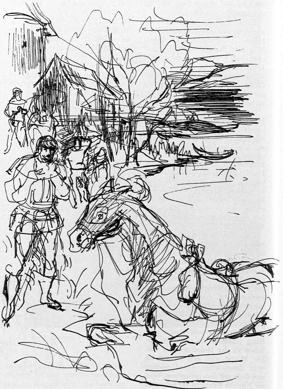
Illustration von Margarethe Lipps aus SJW-Heft Nr. 664 «Zürichsee-Sagen»