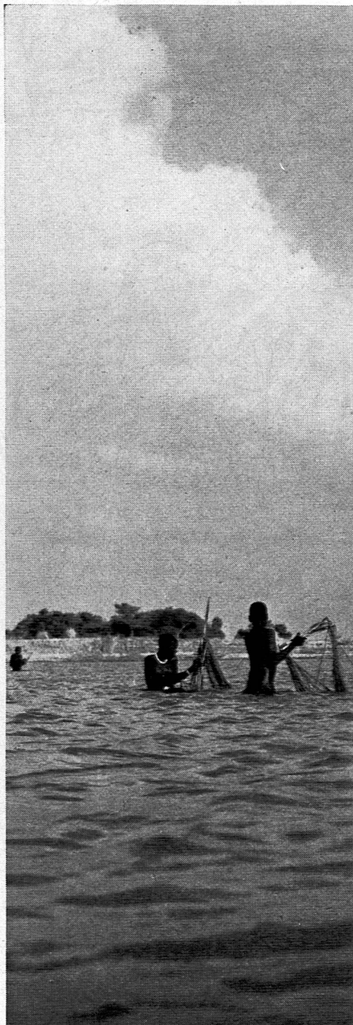
Photographie von René Gardi aus SJW-Heft Nr. 698 «Unter schwarzen Fischern»

hält das Schweizerische Jugendschriftenwerk eine hübsche Auswahl von neuen SJW-Heften sowie von Nachdrucken vergriffener, immer wieder verlangter Titel bereit. Die nachfolgenden bibliographischen Angaben und Textauszüge zeigen, dass das SJW auch diesmal mit seinen spannenden und unterhaltsamen Heften jung und alt zu fesseln vermag.