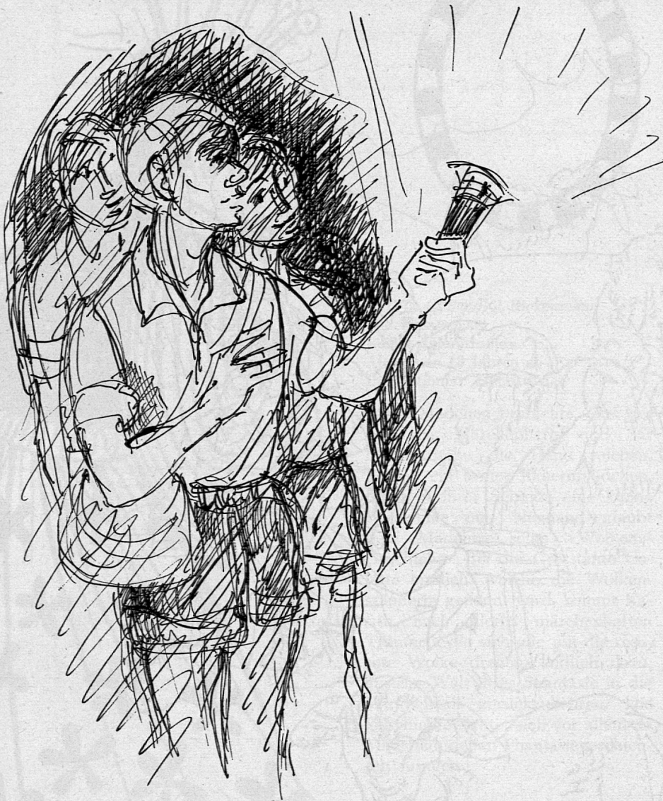
Illustration von Harriet Klaiber aus SJW-Heft Nr. 771 «Drei Burschen — drei Abenteurer»