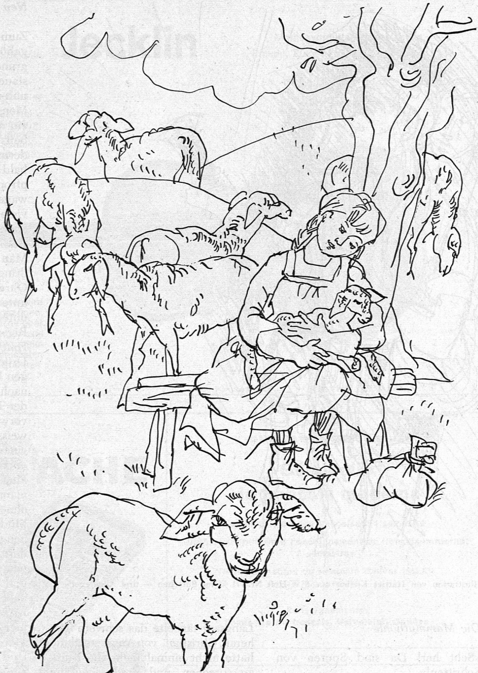
Illustration von Hanni Fries aus SJW-Heft Nr. 772 «Die Rosawolke»