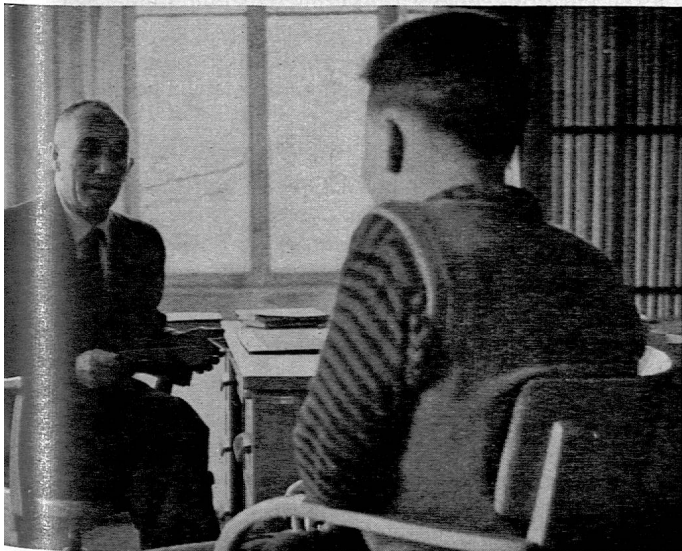
Jugendhilfe durch Gemeinde und Staat