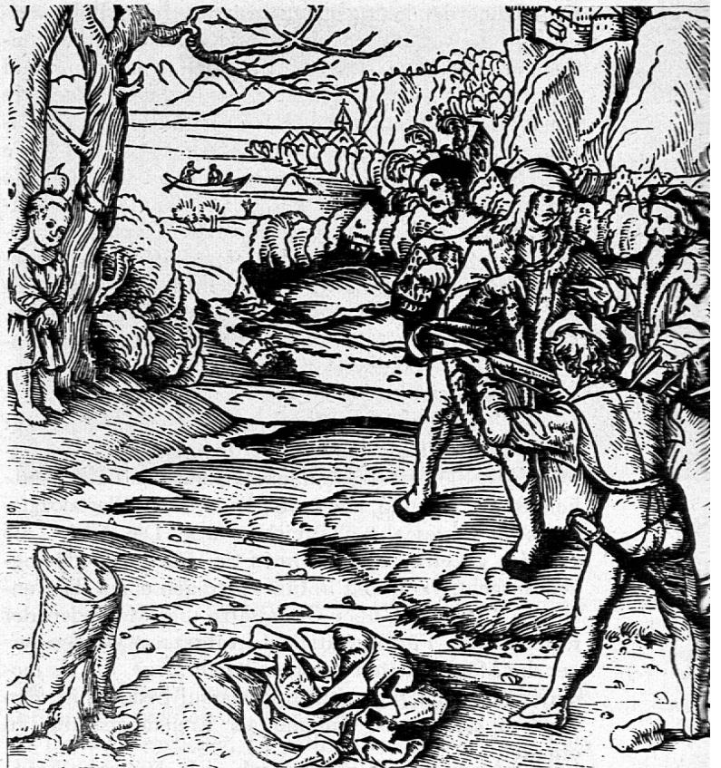
Schillers «Wilhelm Tell» und die Schweiz Holzschnitt aus der Chronik von P. Etterlin, 1507

Im Verlaufe der Monate Februar und März wurden der Lehrerschaft im Neubau des Pestalozzianums die Geschichtslehrmittel aller Schweizer Kantone und solche aus Deutschland und Oesterreich zur Ansicht aufgelegt. Die zahlreichen Bücher boten nicht nur einen sehr instruktiven Einblick in den Geschichtsunterricht des In- und Auslandes, sondern vermochten auch viele Anregungen hinsichtlich der Gestaltung der Lehrmittel und der Veranschaulichung des Stoffes zu bieten. Ferner lagen Werke, die sich im besondern für die Unterrichtsvorbereitung des Lehrers eignen, sowie eine grosse Zahl von Jugendbüchern über geschichtliche Themen vor. In verdankenswerter Weise hatten zudem Firmen die neuesten Geschichtswandkarten, die auf dem Lehrmittelmarkt erhältlich waren, zur Verfügung gestellt. Die Wände des Saales waren mit Schulwandbildern, die Ereignisse einzelner Epochen veranschaulichten, geschmückt. Schliesslich umfasste die Ausstellung noch Dias und Schallplatten. Zahlreiche Kollegen aus ver-