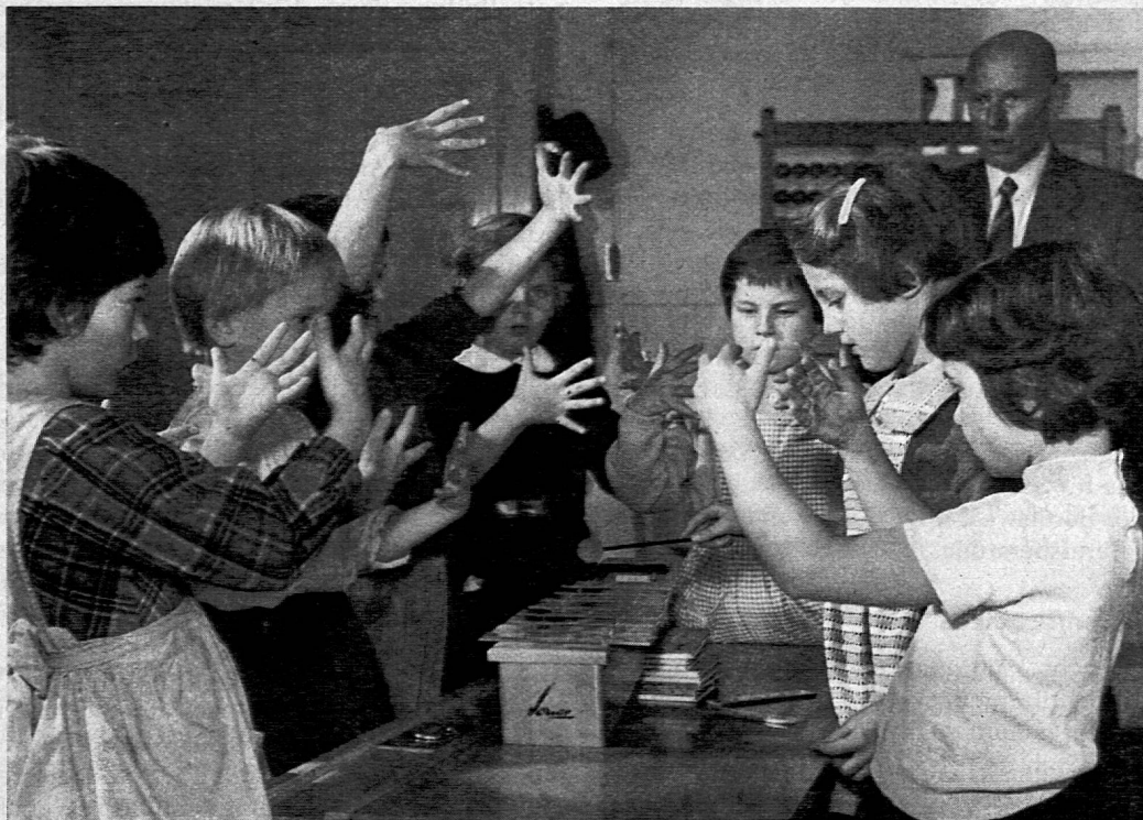
Musische Erziehung auf der Unterstufe

Dank dem grossen Angebot an Kleindias konnte die Sammlung des Pestalozzianums in einem erfreulichen Masse ausgebaut werden. Zu den bereits vorhandenen 220 Kleinbildserien wurden weitere 280 angeschafft, so dass nun für die Schulen und andere Interessenten eine reichhaltige Auswahl zur Benützung bereitsteht. Ein Neudruck des erweiterten Kleinbildkataloges kann nächstens herausgegeben werden. Besonders zu erwähnen sind die Farbphotos von Kunstwerken aus dem Louvre und dem Reichsmuseum in Amsterdam. Sie wurden von