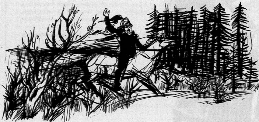
Illustration von Werner Andermatt aus SJW-Heft 784 «Freundschaft mit Habsburg»