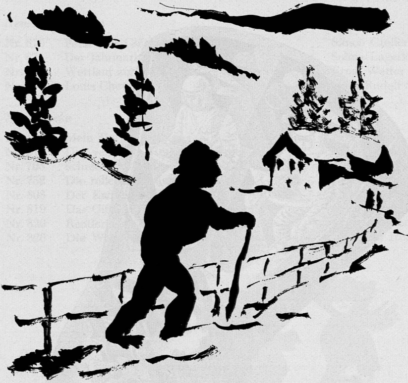
Illustration von Victor Surbek aus SJW-Heft Nr. 870 «Pech oder Glück»

lationen etwas zu tun. Für meinen Mann war es ein Spiel, das alles in Ordnung zu halten.»