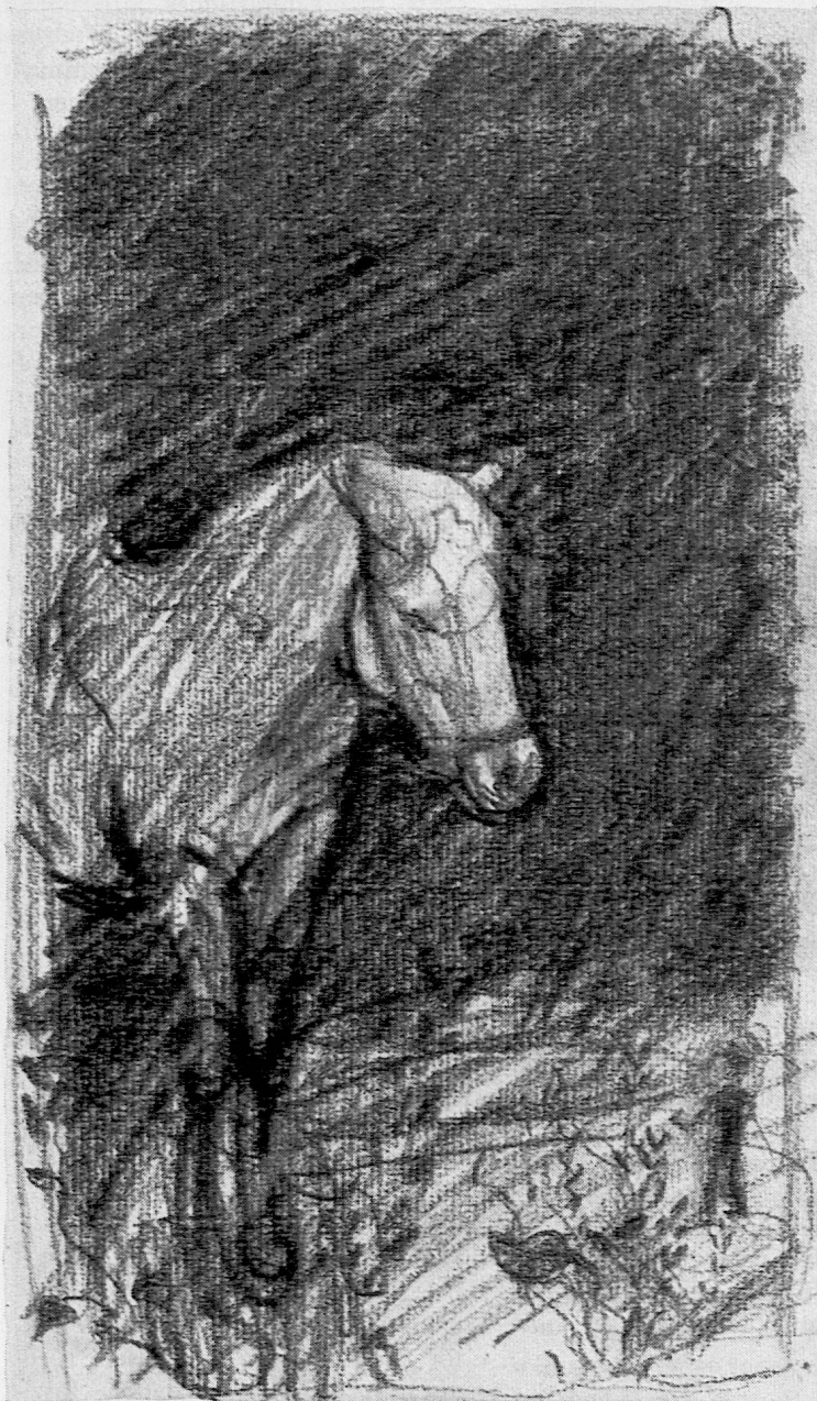
Illustration von Roland Thalmann aus SJW-Heft Nr. 871 «Der Jahrmachtsabend»