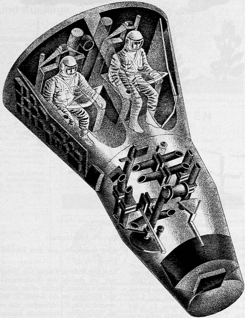
Illustration von Richard Gerbig aus SJW-Heft Nr. 872 «Wettlauf zum Mond»

Ganz ungewohnt für uns Menschen ist die Schwerelosigkeit, denn wir verspüren sie sehr selten. Auf der Erdoberfläche unterliegen wir der Beschleunigung der Erdanziehung, das heisst, wir stehen auf dem Fussboden mit dem Andruck von 1 g. Dieser Andruck kann sich ändern, beispielsweise wenn wir in einem