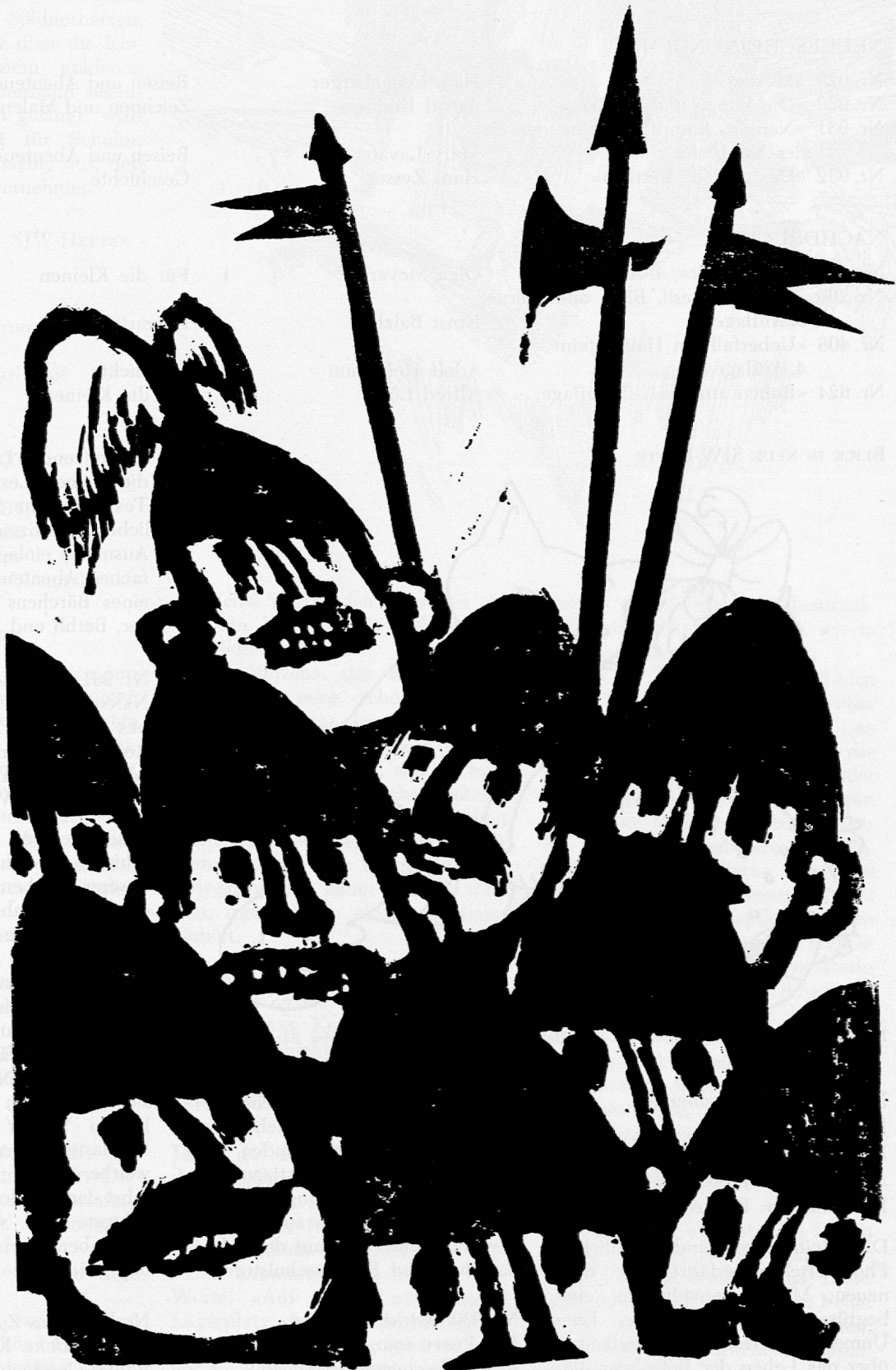
Illustration von Röbi Wyss aus SJW-Heft Nr. 932 «Das goldene Kettlein».