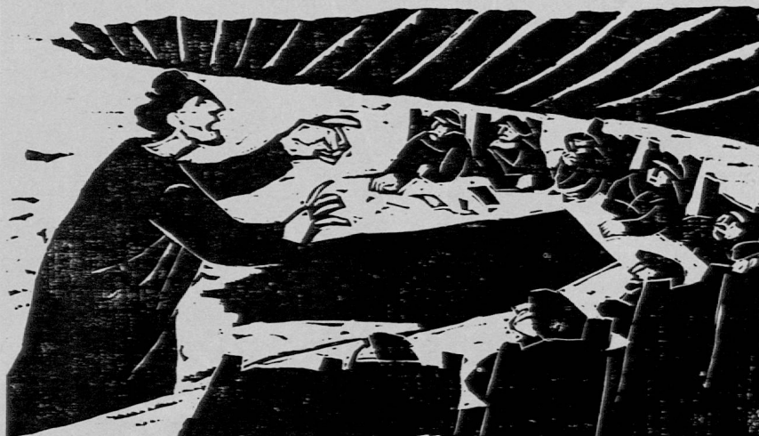
Holzschnitt von Bruno Gentinetta aus SJW-Heft Nr. 1063 «Niklaus von Flüe»