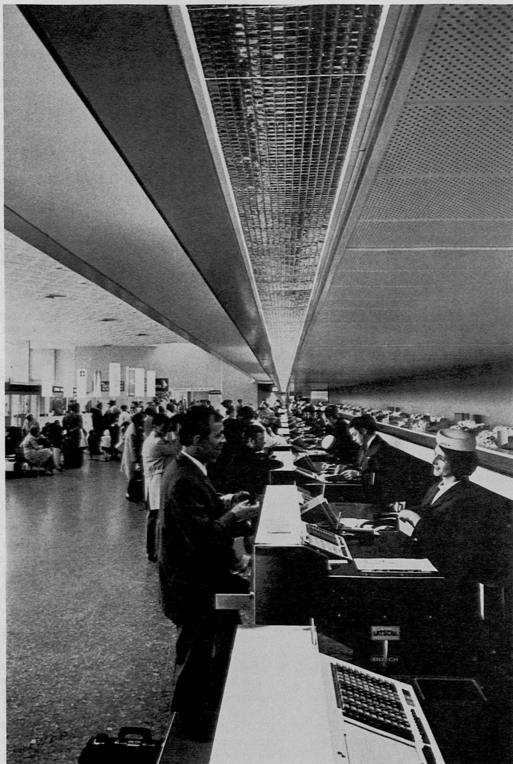
Aus SJW-Heft Nr. 1067 «Auf Besuch bei der Swissair» von Hansuli Hugentobler