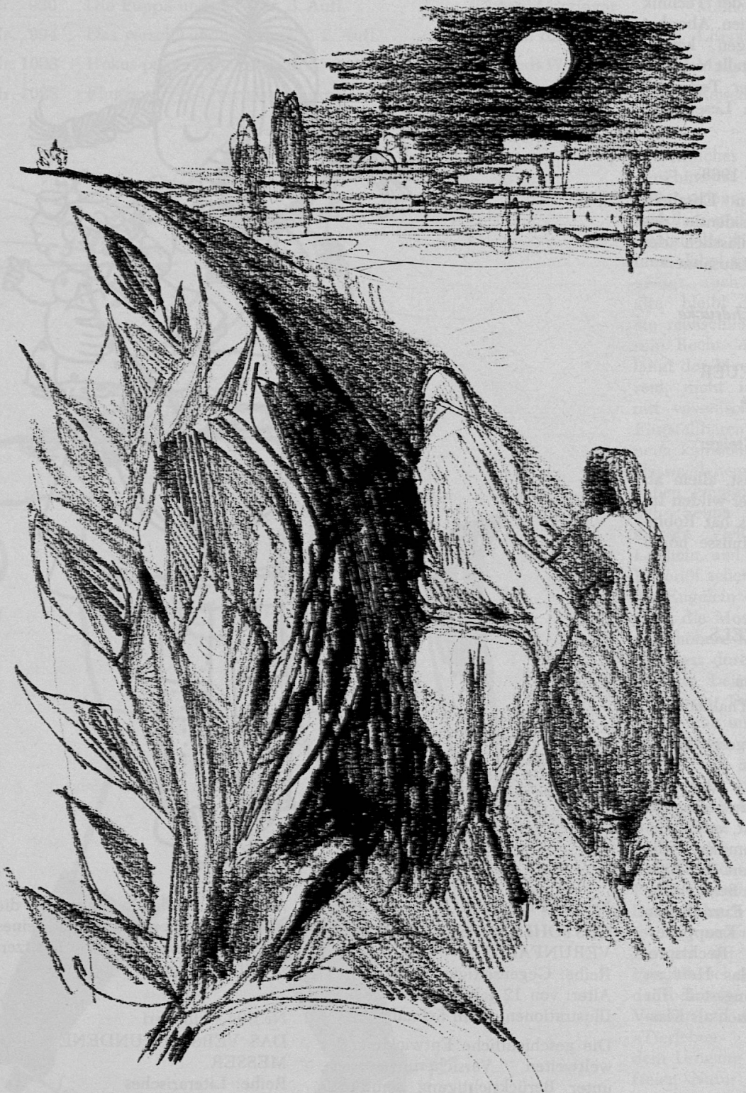
Zeichnung von Sita Jucker aus SJW-Heft Nr. 826 «Die Weihnachtsgeschichte»

Nr. 1003 Trudi Wünsche HOKUS-POKUS-EINS, ZWEI, DREI