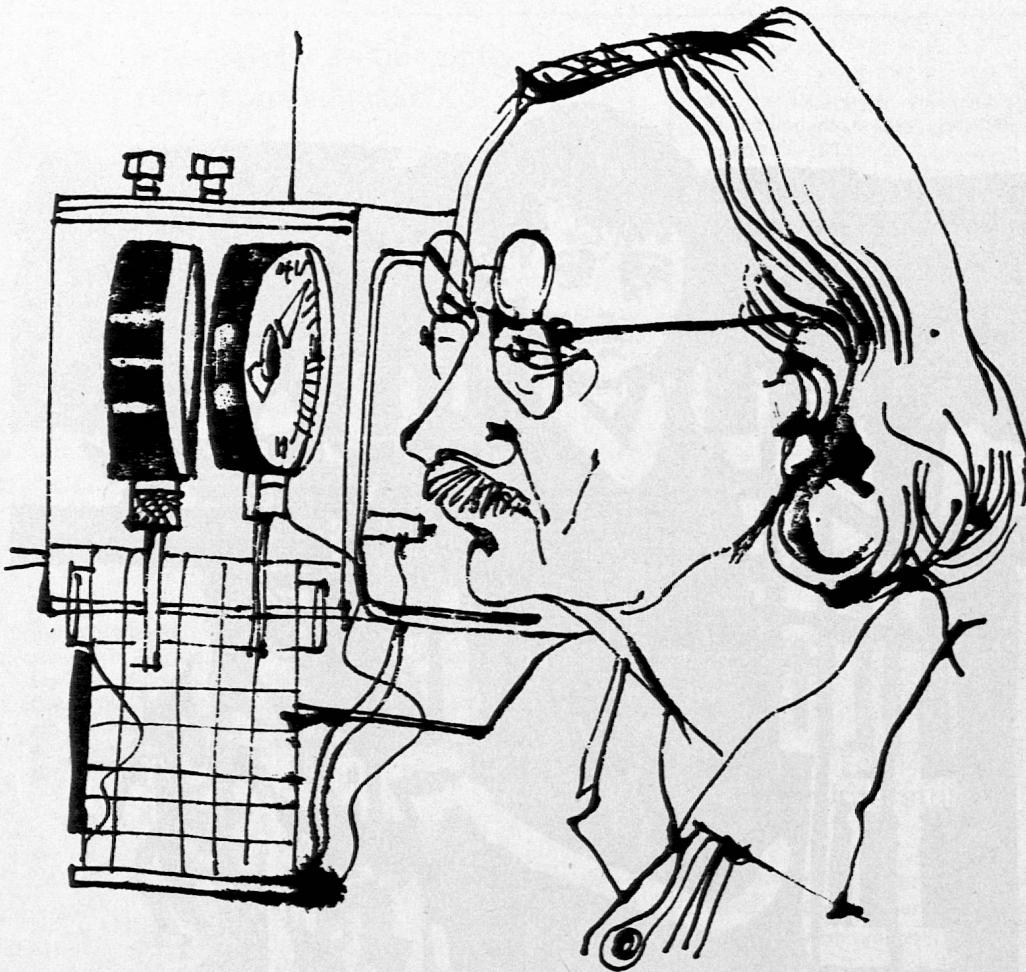
Illustration von Carlos Duss aus SJW-Heft Nr. 1123 «Tauchtiefe 3000»

Kandergrund». Wer Abenteuer liebt, wird sich für Jack Londons Erlebnisse interessieren und für den Tatsachenbericht über die Tauchversuche Piccards. Aber auch die kleinsten Leser werden mit zwei Heften berücksichtigt, die sich vor allem für Mädchen eignen.