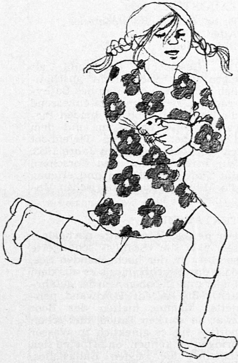
Illustration von Edith Schindler, aus SJW-Heft Nr. 1118 «Vreneli in der Stadt»