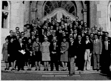
So viele Köpfe – aber grundlegendes Einverständnis über Lehrerbildung und -fortbildung