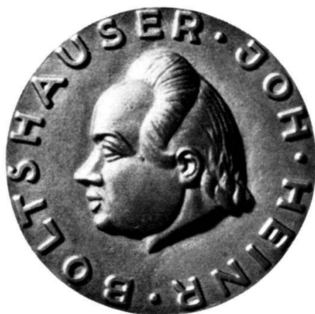
Jubiläumsmedaille J. H. Boltshauser

Auskünfte über die Talerausgabe sowie Talerbestellungen können an das Finanzkomitee der Internationalen Rheinschiffahrtstage 1954, c. o. Bankhaus A. Sarasin & Co., Freiestraße 107, gerichtet werden.