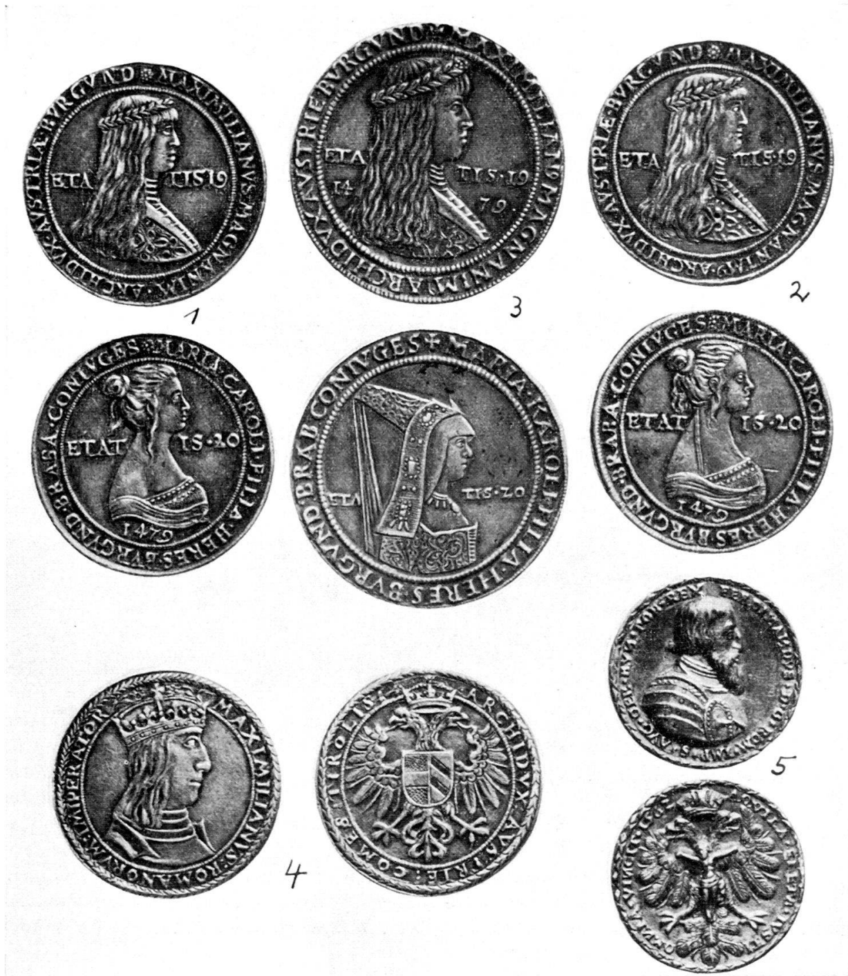
5. Ferdinand I. 1562, nach Medaille von Nickel Milicz, Markl 2081, Katz 322: 28,5 mm, dickste Stelle 3 mm, 12,322 g (Abb. 5). Herkunft unbekannt.

Sämtliche Fälschungen sind Silbergüsse nach Prägungen. Sie sind in den Bildnissen wie in den figürlichen Rückseiten, vor allem aber in den Schriften stark überarbeitet, und zwar vorwiegend mit Hilfe von Punzen. Ganz besondere Aufmerksamkeit ist der Überarbeitung der Schriften gewidmet, um durch Niederschlagen des Fonds in und neben den Buchstaben die Formen der Buchstaben klarer und schärfer zu gestalten und damit die Erscheinung der Prägung vorzutäuschen. Die am häufigsten für diese Zwecke ver-