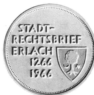
Erinnerungstaler 700 Jahre Stadtrecht Erlach

1266 verlieh Graf Rudolf II. von Neuenburg-Nidau dem Marktflecken Erlach am Bielersee eine Handfeste, um die Bürgerschaft des strategisch wichtigen Punktes zu stärken. Daran soll dieser Taler erinnern. Entwurf und Prägung wurden von der Firma Huguenin in Le Locle besorgt.