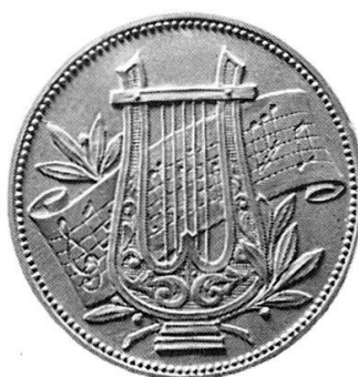
Erinnerungstaler XIV Convegno Bandistico Ticinese, 3. Juli 1966 Balerna

Dieser Taler, der sich durch seine Häßlichkeit auszeichnet und stilistisch aus dem 19. Jahrhundert stammen könnte, wurde durch die Firma Argor in Chiasso hergestellt.