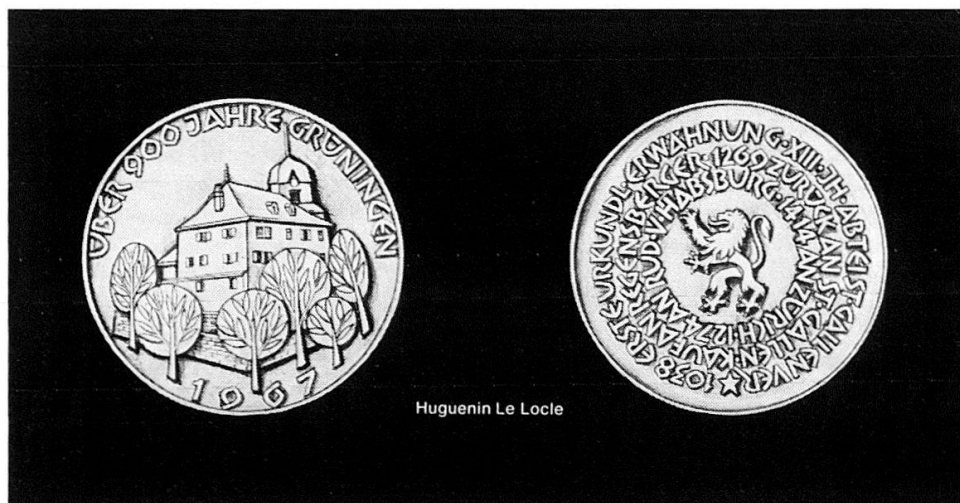
Huguenin Le Locle