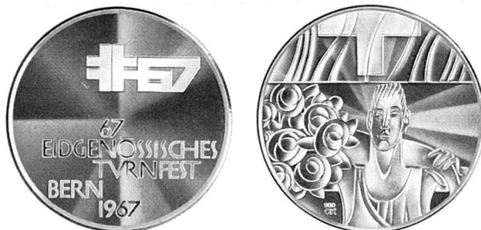
67. Eidgenössisches Turnfest Bern 1967

Vom 22. bis 25. Juni 1967 wird in Bern das Eidgenössische Turnfest stattfinden. Zur Feier dieses Ereignisses wurde vom Organisationskomitee ein Taler herausgebracht, der von den Graphikern Herbert Auchli und Werner Mühlemann gestaltet und in der Eidgenössischen Münzstätte geprägt wurde.