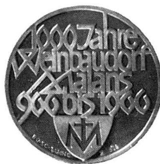
Jubiläumstaler 1000 Jahre Weinbaudorf Malans

Kaiser Otto I. schenkte 966 dem Bischof Hartbert von Chur die Weinberge in Malans und begründete damit das Weinbaudorf. Zur Erinnerung an dieses Ereignis ließ die Gemeinde Malans durch die St. Galler Präge einen Taler herstellen, der vom Graphiker Walther Büsser entworfen wurde.