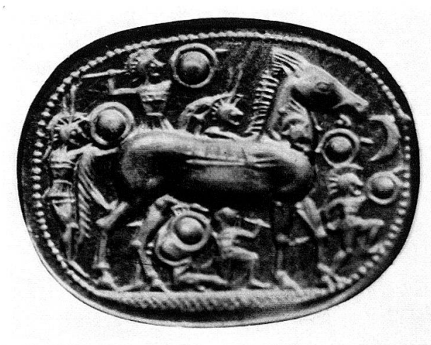
Abb.4 Skarabäus, New York, Vergr.