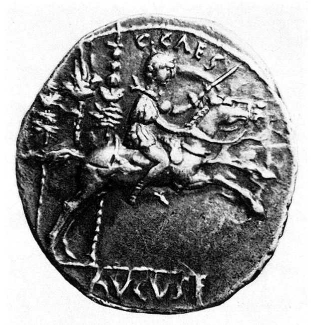
Abb.5 Denar, Paris, Cab. Méd., Vergr.