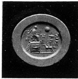
Abb.3 Wie Abb.1 (1:1)