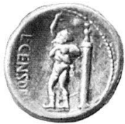
2. Statue des Marsyas , Forum Romanum. Denar des L. Marcius Censorinus, um 84 v. Chr. Inv./Wegeli-Hofer 307. Sydenham CRR 737.