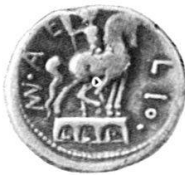
1. Reiterstatue des Mn Aemilius Lepidus , Capitolium. Denar des Mn Aemilius Lepidus, um 109 v. Chr. Inv./Wegeli-Hofer 83. Sydenham CRR 554.

Das Material ist keineswegs vollständig, da das Münzkabinett nur einen Teil der Münzen dieser Gattung enthält. Von verschiedenen Varianten wurde jeweils das besterhaltene Exemplar ausgewählt.