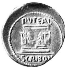
4. Puteal Libonis , Forum Romanum. Denar des P. Scribonius Libo, um 55 v. Chr. Inv./Wegeli-Hofer 446. Sydenham CRR 928.