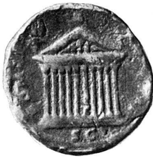
25. Tempel der Venus und Roma . Sesterz des Antoninus Pius, um 140–144 n. Chr. Inv. 1488. RIC 622.