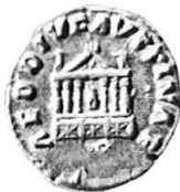
27. Tempel der Diva Faustina , Forum Romanum. Errichtet 141 n. Chr. von Antoninus Pius für seine verstorbene Frau. Nach seinem Tode 161 n. Chr. wurde der Tempel auch ihm dediziert. Denar des Antoninus Pius, 141 n. Chr. Inv. 1573. RIC 343.