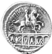
3. Reiterstatue des Q. Marcius Rex , Capitolium. Denar des Marcius Philippus, 56 v. Chr. Inv. 1135, vgl. Jb. Bern. Hist. Mus. 1959 bis 1960, 258, Sydenham CRR 919.