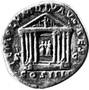
26. Tempel des Divus Augustus , Forum Romanum, in der Gegend hinter dem Tempel des Castor und Pollux. Sesterz des Antoninus Pius, 158–159 n. Chr., unter dessen Herrschaft der Tempel restauriert wurde. Inv. 1507. RIC 1004.