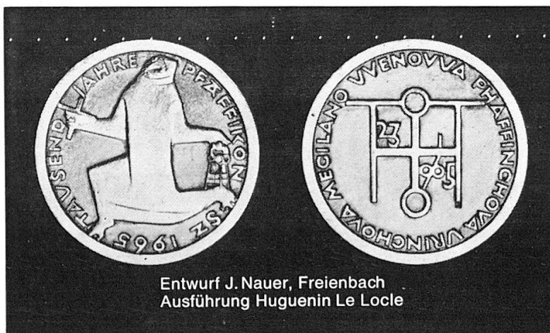
Entwurf J. Nauer, Freienbach Ausführung Huguenin Le Locle