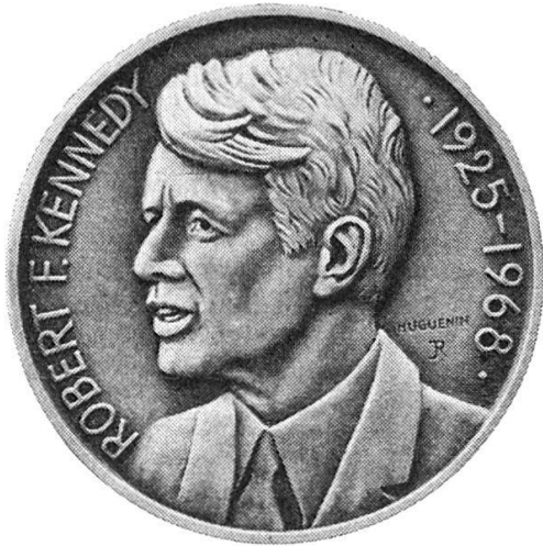
Huguenin Le Locle

Medaillen für Sammler Verlangen Sie unseren Katalog Médailles pour numismates Demandez notre catalogue