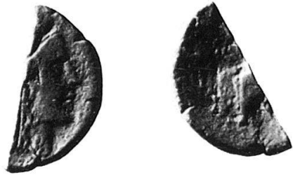
2 Nr. 10, Rregion