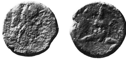
4 Nr. 16, Iaitas