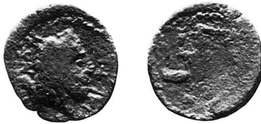
5 Nr. 17, Iaitas