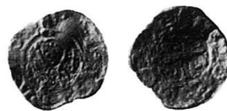
7 Nr. 24, unbekannt