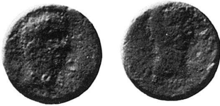
3 Nr. 15, Panormos