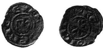
6 Nr. 21, Friedrich II.