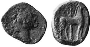
1 Nr. 1, Punisch