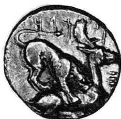
Fig. 1 Citium. Pumiathon (circa 361–312 a. C.). Emistatere d'oro (Coll. privata).

Il motivo del leone che assale la sua preda è notevolmente diffuso sia nelle antiche sculture medio-orientali, greche e romane, sia nelle pitture su vasi, sia nelle monete; J. Desneux si è abbastanza recentemente intrattenuto sull'argomento (RBN 1960).