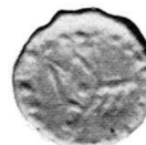
Abb. 2 (alle 2:1)