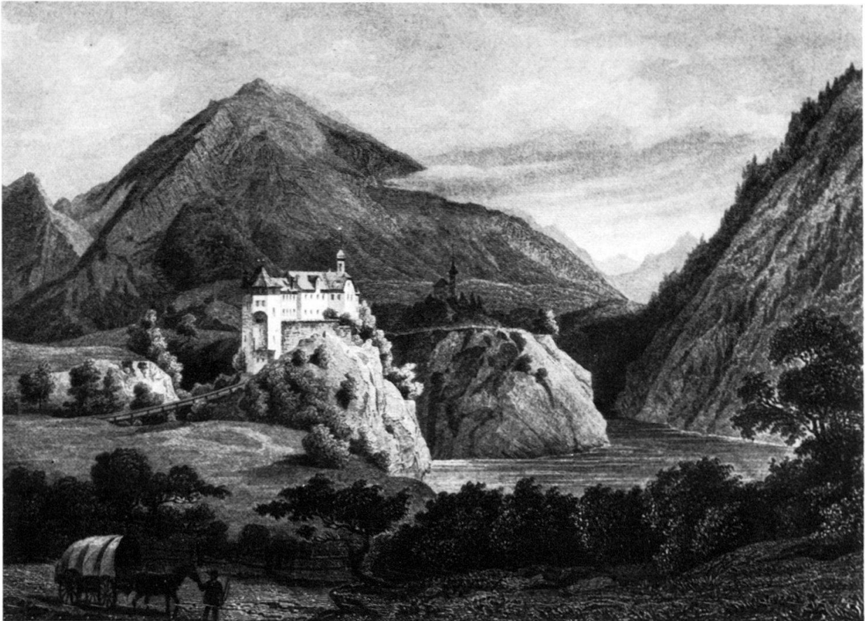
Abb. 2 Schloß Rhäzüns. Stahlstich von L. Rohbock, Mitte 19. Jahrhundert. Zwischen dem Schloß und dem Pferdegespann im Vordergrund der noch intakte Hügel Saulzas. Rechts hinten die Kirche St. Georg. Im Hintergrund der Calanda, links davon der Kunkelspaß.