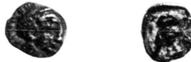
Abb. 3, Maßstab 3 : 1

Die Münze ist ungewöhnlich klein, 0,044 g schwer und sehr gut erhalten. Auf der Vorderseite trägt sie den behelzten Kopf der Athena nach rechts, auf der Rückseite im Quadratum incusum die nach rechts stehende Eule, mit einem Olivenblatt auf der linken und mit den Buchstaben ΑΘ auf der rechten Seite. Der Stil des behelzten Athena-Kopfes weist in das frühe 4. Jahrhundert (s. Abb. 3).