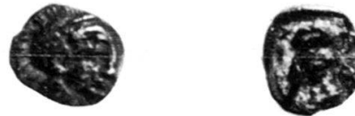
Abb. 3, Maßstab 3 : 1

Die Münze ist ungewöhnlich klein, 0,044 g schwer und sehr gut erhalten. Auf der Vorderseite trägt sie den behelmetten Kopf der Athena nach rechts, auf der Rückseite im Quadratum incusum die nach rechts stehende Eule, mit einem Olivenblatt auf der linken und mit den Buchstaben ΑΘ auf der rechten Seite. Der Stil des behelmetten Athena-Kopfes weist in das frühe 4. Jahrhundert (s. Abb. 3).