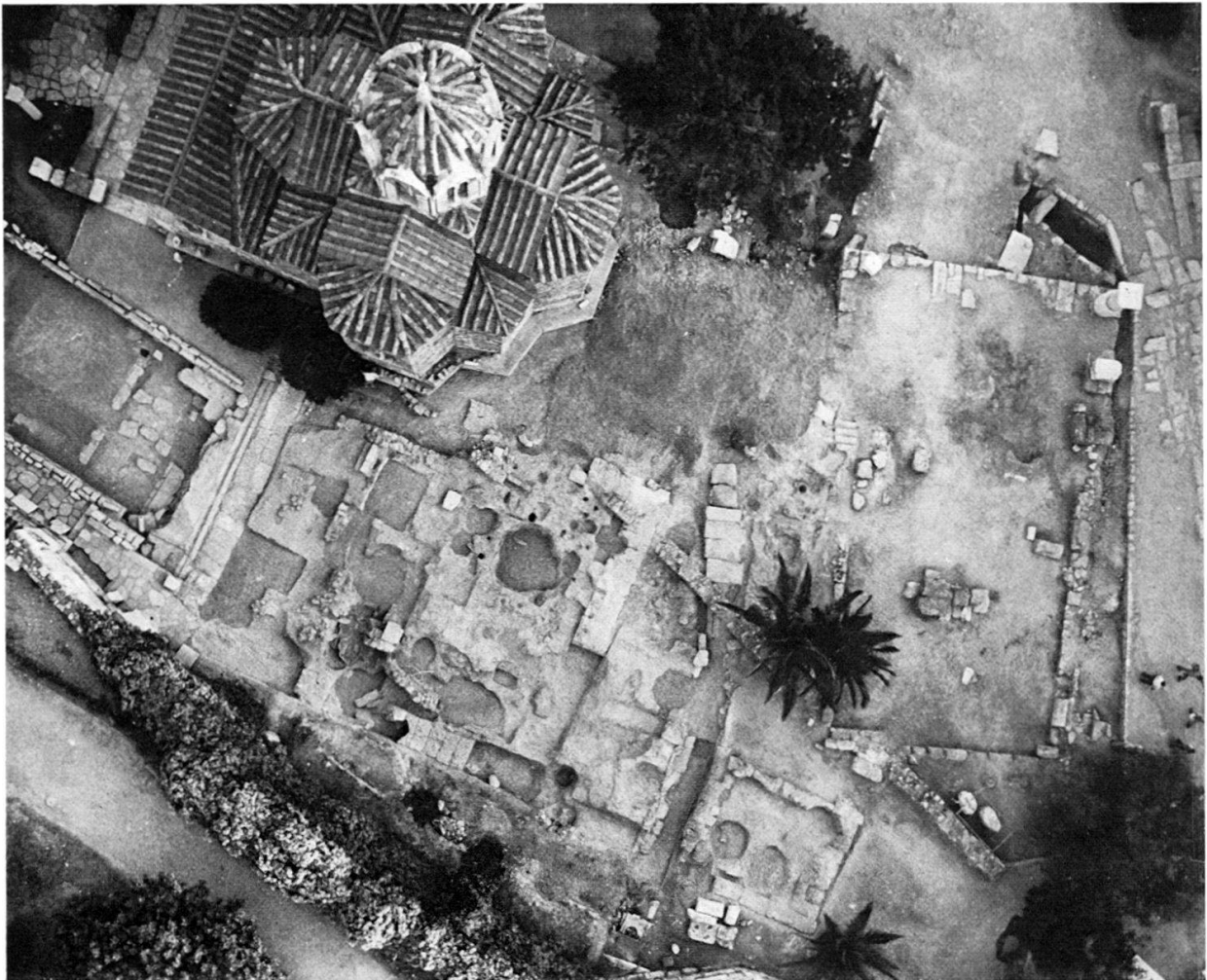
Abb. 2 Die Fundamente der Münzstätte aus der Vogelschau (Phot. Agora Excavations).

Zufall, daß die Metronomoi , die staatlichen Eichbeamten, ihren Sitz in der Nachbarschaft hatten.