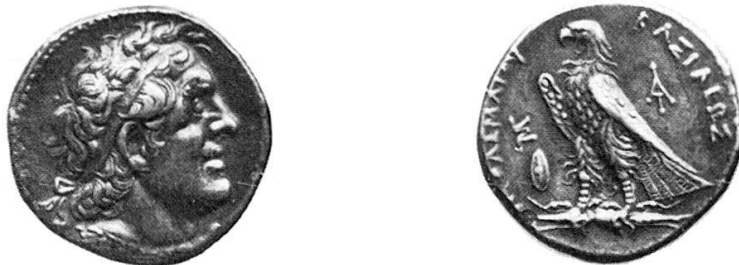
1 a Tetradrachme des Ptolemaios II., Auktion Münzen und Medaillen AG 54 (1978), 395.

Die Interpretation des Beizeichens steht und fällt also mit seiner typologischen Bestimmung. Darum seien die Münzschilde noch einmal betrachtet. Unter der reichen Prägung des Philadelphos gibt es verschiedene Serien datierter und undatierter Prägungen in Gold, Silber und Bronze, die alle durch das Beizeichen des Schildes auf der Rückseite miteinander verbunden sind (Abb. 1 a) 4 . Hinzu kommt die Gruppe der ΘΕΩΝ ΑΛΕΛΦΩΝ-Münzen mit Schild, die Svoronos wie Voegtli ebenfalls in die Zeit des Philadelphos verweisen (Abb. 1 b) 5 . Die Form dieser Schilde ist oval, allerdings im Umriß nicht ganz einheitlich; er schwankt von eiförmig bis spitzoval.