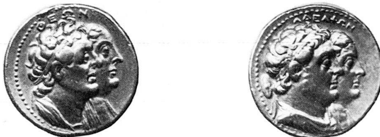
1 b Mnaeion (Gold-Oktadrachmon) des Ptolemaios II., Auktion Münzen und Medaillen AG 52 (1975), 238.

Nach Voegtlis Ansicht fehlen für diese Schildformen griechische oder makedonische Belege. Keltische Schilde haben zwar ovale Form, jedoch läßt sich daraus nicht der Schluß ableiten, daß alle ovalen Schilde keltisch sind, wie F. Meyer in einer Untersuchung über keltische Funde in Griechenland gezeigt hat 6 . Die näch-