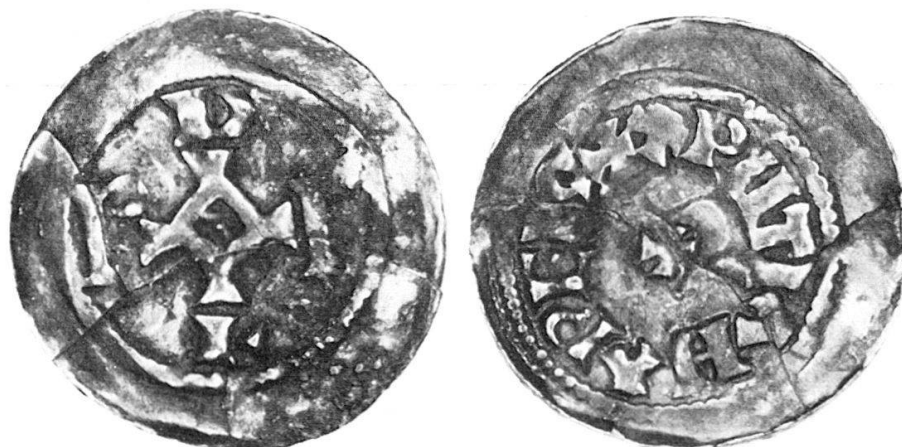
Abb. 1 a (2 : 1)