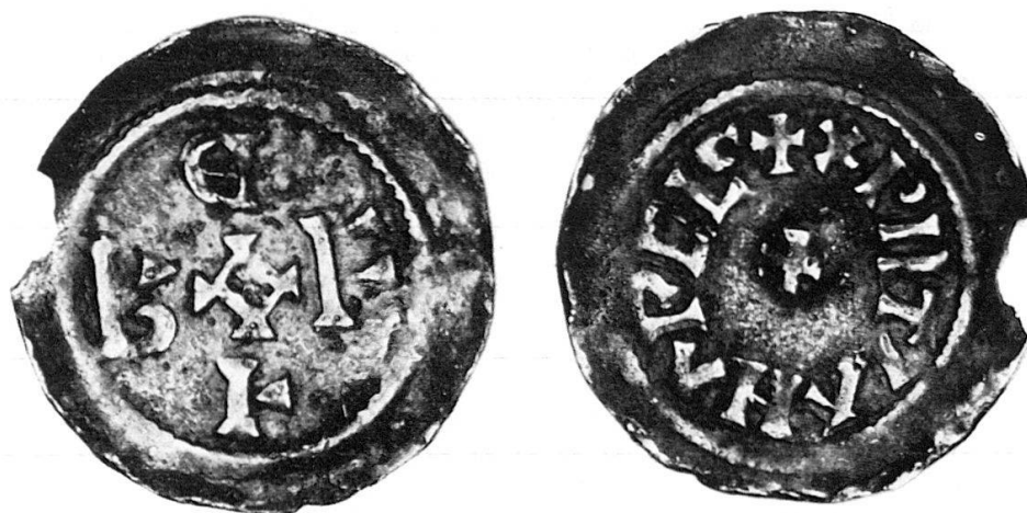
Abb. 1 b (2 : 1)

Dieser durch Monogramm und Umschrift von den Konraddenaren abweichende Typus findet sich nirgends in der einschlägigen Literatur, noch war er im Funde der Stiftskirche St. Ursus in Solothurn vertreten 2 . Die Auflösung des Monogramms be-