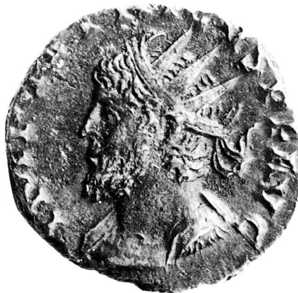
Fig. 2 (x 3)