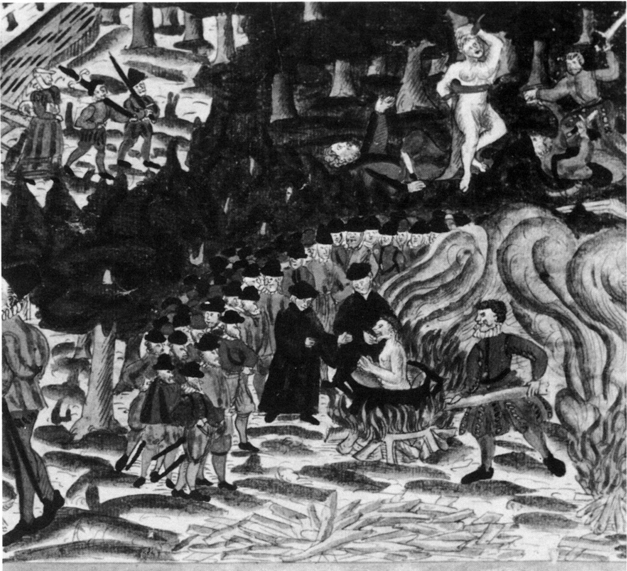
Abbildung 2 Die Strafe des Siedens nach einer Abbildung der Wickiana, einer Nachrichtensammlung des Johann Jakob Wick aus dem 16. Jahrhundert. Zentralbibliothek Zürich, Ms. F. 35, S. 343a.