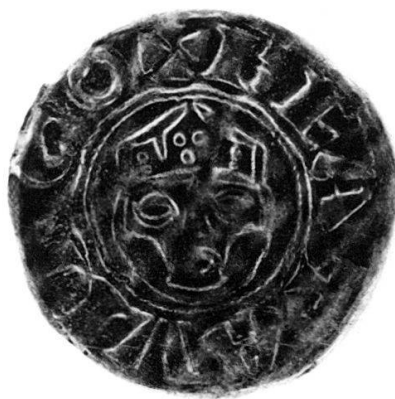
Photos A et B superposées