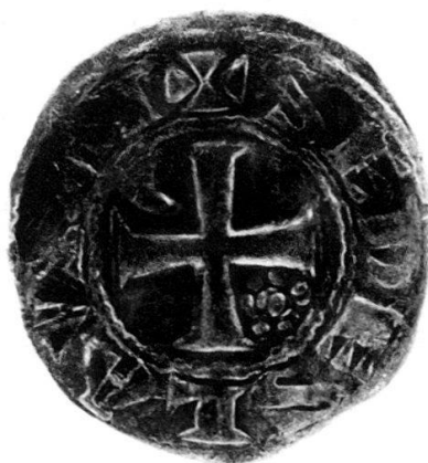
Photos A et B superposées