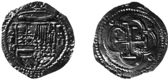
Abb. 4: Spanien, Philipp II. (1556–1598), Doppia (2 Escudos) o. J., Münzstätte Toledo.