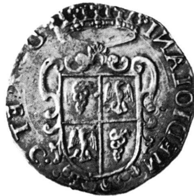
Abb. 6: Mailand, Philipp III. (1598–1621), Ducatone 1608

neuen Kursvorschläge: Zecchinen von Venedig und von Ungarn 75 Gros, Sonnenkrone 67 Gros, Goldpistole 64 Gros; die Ducatonen (nur von Mailand?) wurden vom Landrat wieder auf 56 Gros heraufgesetzt 12 . Unser Dokument, die Abschrift der Landratssitzung im Sommer 1611, hatte seine Aktualität bereits wieder verloren.