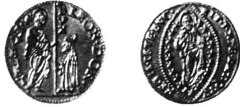
Abb. 5: Venedig, Leonardo Donà (1606–1612), Zecchino o. J.