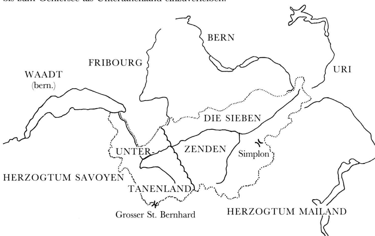
Abb. 1: Das Wallis und seine Nachbargebiete.

In der Zeit der Burgunderkriege und im Zuge der Eroberung der Waadt durch die Berner gelang es den Wallisern, vor allem auf Kosten Savoyens, sich die westlichen Rhonetalgebiete bis zum Genfersee als Untertanenland einzuverleiben.