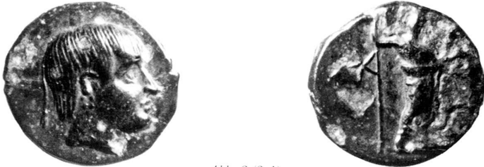
Abb. 2 (3:1)