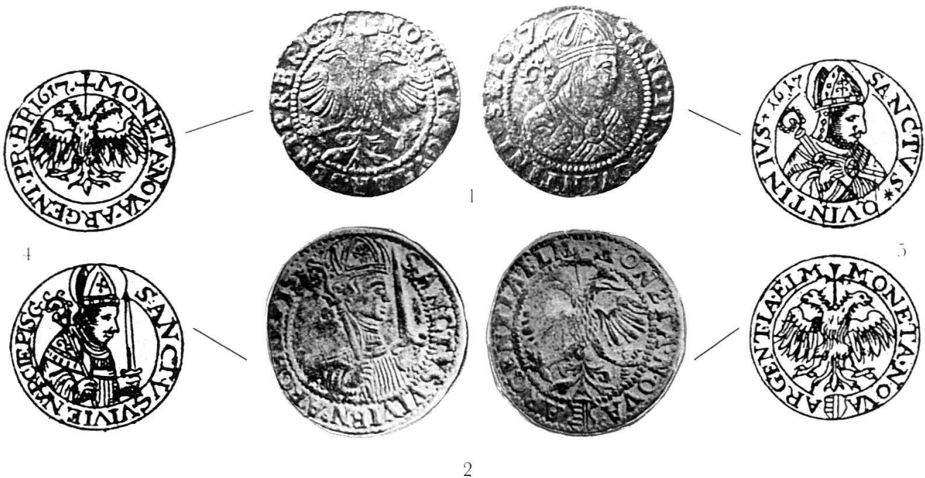
Abb. 8 Zusammenstellung der vier Kombinationen von Vorder- und Rückseiten von Nr. 1, 2, 4 und 5.