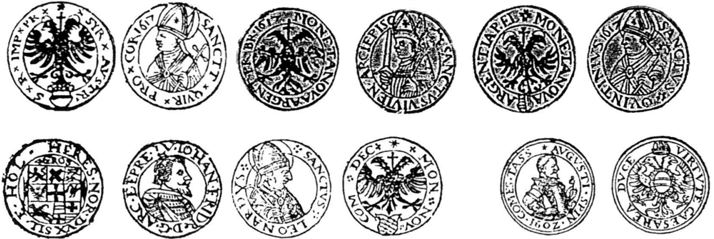
Abb. 7 Illustrierte Münzordnung (40x73 cm) des Oberrheinischen Kreises (Darmstadt 1620) aus Klüssendorf (Anm. 8), Ausschnitt.

Diese Stück Dickpfening vnd alle dergleichen sind verboten.