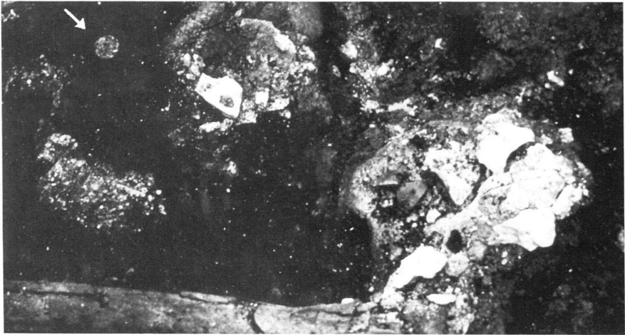
Abb. 3: Fundlage der Silbermünze (nach Farbdiagramm vom 17. 11. 1989).