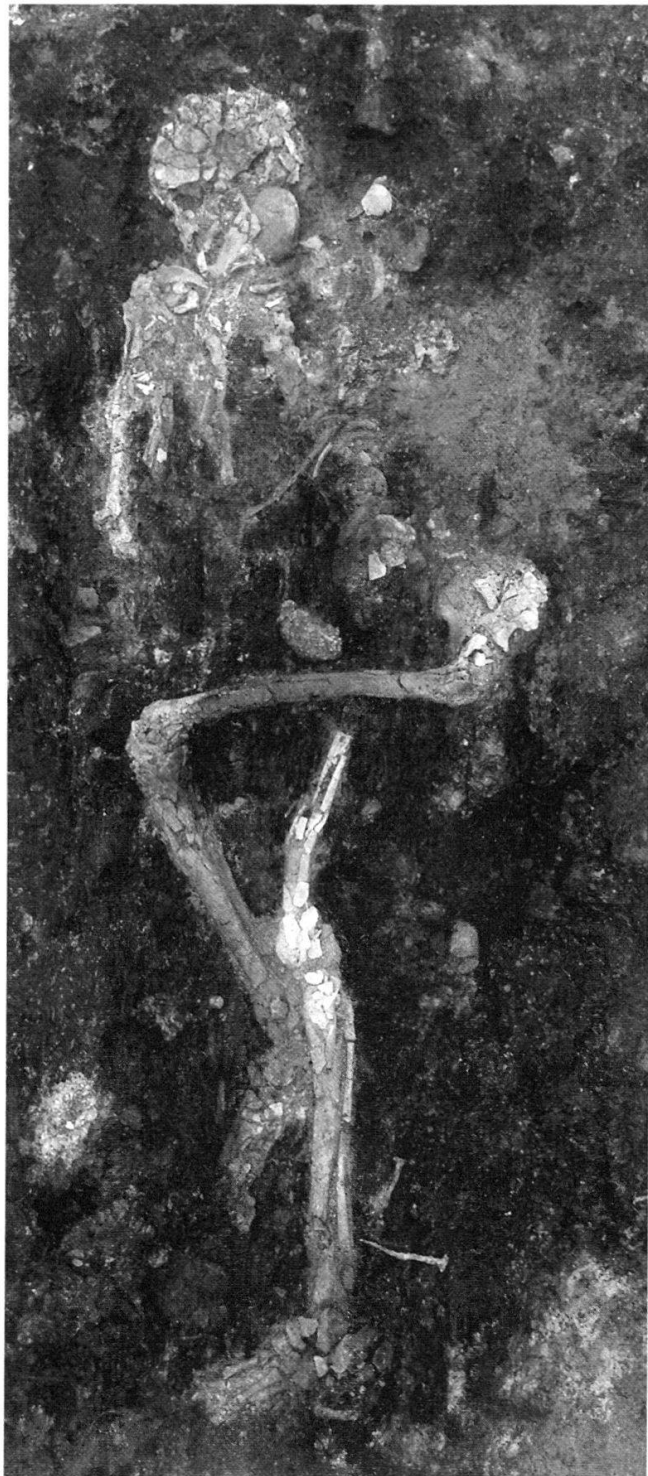
Abb. 1: Gesamtansicht des Skeletts des « Romain de Saint-Antoine ».

Als sichergestellt war, dass die photographische Dokumentation des Zustandes der Münzen vor der Reinigung befriedigend ausgefallen war, wurden am 30. 10. 1989 die SAF-Datenblätter der sieben Fundstücke vorbereitet und dieselben am 6. 11. 1989 den Laboratoires MAHG zur Reinigung und Konservierung überbracht.