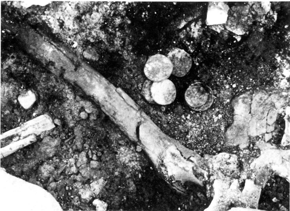
Abb. 2: Fundlage der Aesmünzen (nach Farbdiagramm vom 13.10.1989).