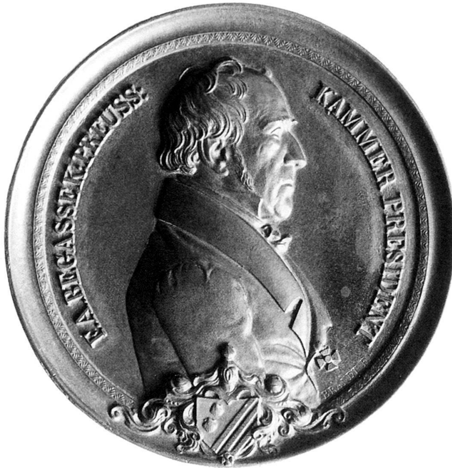
Abb. 15: HFB, F.A. Begasse, o.J. (um 1835?) Guss, Bronze, 91 mm