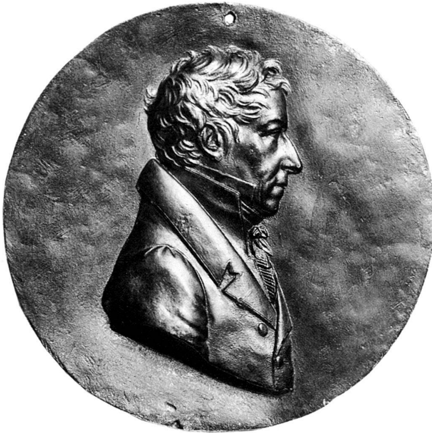
Abb. 1: Leonhard Posch, Selbstbildnis, 1815 Guss, Zinnmodell, 87 mm