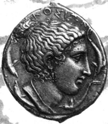
Syracuse, vers 410 avant J.-C.