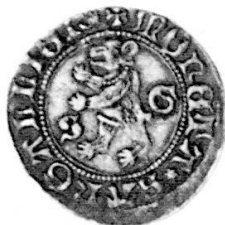
Abb. 1: Das Stück von Edwin Tobler; Billon, 1,95 g, 135°.

Im SM Nr. 173 (Juli 1994), S. 31 (R. Kunzmann, Noch ein Exemplar der rätselhaften Münze aus St. Gallen) wurde irrtümlich die Rs. von Abb. 1 zweimal reproduziert. Die beiden Abbildungen sind hier deshalb nochmals wiedergegeben; für die Verwechslung bitten wir um Entschuldigung.