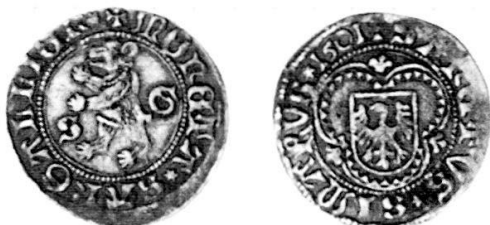
Abb. 1: Das Stück von Edwin Tobler; Billon, 1,95 g, 135°.

In der Zwischenzeit ist ein zweites Stück dieses SIMARVS-Plapparts zum Vorschein gekommen, welches der Unterzeichnende neben die oben erwähnte Münze legen und vergleichen konnte ( Abb. 2 ). Beide Stücke sind aus demselben Stempelpaar geprägt und scheinen von ähnlichem Metall zu sein, ja auch die stellenweise bräunliche Patina ist beiden gemeinsam, so dass der Verdacht aufkommt, dass der Fund- bzw. Herstellungsort, obwohl auch im Fall des zweiten Plapparts unbekannt, identisch sein könnte.