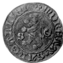
Abb. 2: Billon, 2,15 g, 90° (Zweites bekanntes Stück).