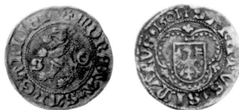
Abb. 2: Billon, 2,15 g, 90° (Zweites bekanntes Stück).

nung MONETA SANGALLIEN , welche auf dem Original immer getrennt als MONETA SANCTI GALLI geschrieben ist, und auf der Rückseite den Namen SANCTVS SIMARVS , einen völlig unbekanntes Heiligen. Auch die Zeichnung der einzelnen Details