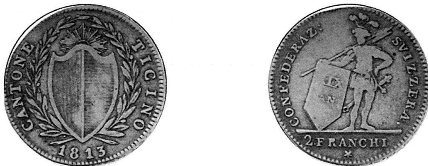
Abb. 1: Kt. Tessin, 2 Fr. 1813, Stempelvariante der Rückseite

Unter Nr. 4 ist eine Variante des 2-Fr.-Stücks von 1813 wiedergegeben und auf Seite 76 ein Stempel zu diesem Nominal, der sich aber bei genauer Kontrolle als verschieden von der abgebildeten Münze erweist. Wir haben diese neue Stempelvariante, welche sich einfach an der Stellung des Sterns zu den Buchstaben des Wortes FRANCHI erkennen lässt, gefunden und an dieser Stelle reproduziert (Abb. 1). 3