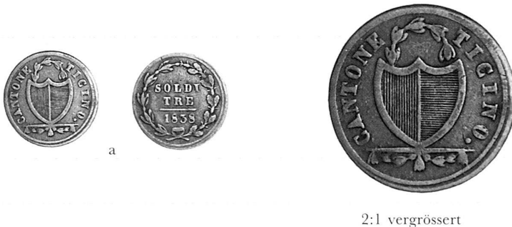
Abb. 4 a–d: Vermutete zeitliche Prägefolge von vier Münzen mit identischen Vs.-Stempeln.

a) 3 Soldi 1838 (Della Casa 29), frühe Prägeperiode.