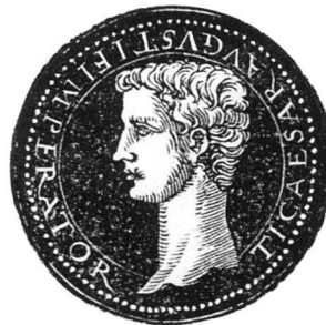
Abb. 2: Tiberiusdarstellung aus Jacobus de Strada « Epitome thesauri Antiquitatum ».

Diese Textstelle bedarf der Erläuterung. Hier werden nämlich zum ersten Mal Rand und Umschriften genannt, die, obwohl Rütger von der Horst die Verträge in der Regel sehr genau und eindeutig formuliert, bei den Verträgen mit Wilhelm Vernukken nie auftauchen. Die Untersuchung der erhaltenen Reste hat aber bestätigt, dass jedes Medaillon aus einer modelgefertigten Grundfläche mit Dekorrand und wahrscheinlich aufgelegter Inschrift und einem ebenfalls mit einem Model hergestellten Kaiserporträt zusammengesetzt ist. Es erscheint daher wahrscheinlich, dass Meister Dietrich aus Köln nur die Holzmodel für die Köpfe empfangen hat, während die Anfertigung der Grundfläche ihm aufgetragen wurde und Rütger von der Horst ihm eben dafür ein Buch als Vorlage zur Verfügung stellte.