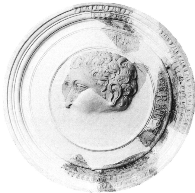
Abb. 1: Der erste Rekonstruktionsvorschlag des Kaisermedaillons, nach dem jetzigen Stand ist das über dem Kopf sitzende Fragment wahrscheinlich vor dem Gesicht anzuordnen.

1990 begannen archäologische Untersuchungen an Schloss Horst, einem der bedeutendsten Renaissanceschlösser Nordwestdeutschlands, von dem heute jedoch nur noch Reste erhalten geblieben sind 1 . Die Anlage wurde vom kurkölnischen Marschall und Statthalter des Vestes Recklinghausen, Rütger von der Horst, nach 1554 an Stelle der durch einen Brand schwer beschädigten väterlichen Burg errichtet 2 . Es entstand ein vierflügeliger Bau von rund 50 m Kantlänge, an den Ecken waren vier Türme vorgeschoben. Die mit reicher Sandsteinzier repräsentativ ausgeführten Flügel im Norden waren zweigeschossig ausgeführt, während die Flügel im Süden eingeschossig blieben. Das Bauwerk war mit seiner architektonischen Konzeption und seiner bauplastischen Ausführung in jener Zeit einzigartig in Westfalen.