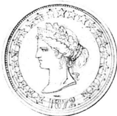
Fig. 2: Mine de plomb sur papier, 9,7 x 9 cm (diam. 55 mm). CdN 1999-5; Photo Nathalie Sabato