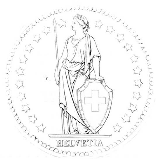
Fig. 3: Albumine retouchée à l'encre de Chine et au crayon, collée sur carton, 17,9 x 15 cm (diam. 145 mm). CdN 1999-9; Photo Nathalie Sabato