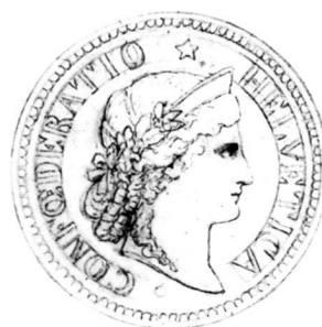
Fig. 5: Mine de plomb (rehauts de gouache blanche) sur papier calque encollé sur bristol, env. 14,4 x 14,4 cm (diam. 53 mm). CdN 1999-8

Ce partage des tâches n'aurait rien d'étonnant, et il serait le même que celui qui présida à la création des pièces les plus stables de l'histoire monétaire de la Confédération, celles de 2, 1 et 1/2 Fr. En 1874, le projet d'Albert Walch, retenu, fut gravé par Antoine Bovy. L'Helvétia – Déméter sur fond de montagnes en 1850 –, y prenait l'aspect d'une Athéna couronnée de lauriers 16 .