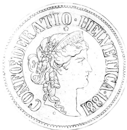
Fig. 4: Mine de plomb sur papier calque encollé sur bristol, env. 18 x 18 cm (diam. 137 mm). (Le format des lettres était plus grand que sur la pièce définitive.) CdN 1999-6

Le 3 mars, Bovy recevait une lettre du Département fédéral des finances, lui apprenant «que le Conseil fédéral a adopté, dans sa séance du 1 er mars courant, le dessin présenté par M r Durussel, graveur à Berne, pour le coin destiné à la frappe d'or de la Confédération et l'a chargé de la confection de ce coin.» 12 Le deuxième essai de la pièce de 20 Fr., qui porte la date de 1871 et la signature de DURUSSEL à l'exergue, présente une tête à gauche savamment coiffée 13 . Deux dessins et une photographie, contenus dans le portefeuille nouvellement acquis par le Cabinet de numismatique de Genève, s'en rapprochent sensiblement. L'un est expressément attribué à Albert Walch 14 , l'autre, portant la date 1872, est à la fois très proche du style de l'esquisse précédente – on est tenté de l'attribuer également à Walch –, et de l'essai frappé. De là à penser que Walch est le véritable auteur du projet gravé ensuite par Durussel, malgré l'affirmation contraire contenue dans la lettre du Département des finances à Antoine Bovy, du 3 mars, citée plus haut, il n'y a qu'un pas 15 .