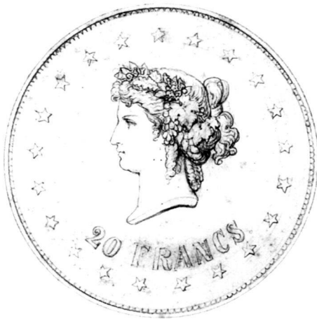
Fig. 1: Mine de plomb sur papier, 22,3 x 18,2 cm (diam. 119 mm). Nombreux repentirs, en bas à gauche «A. Walch». CdN 1999-4; Photo Nathalie Sabato

Le Cabinet de numismatique du Musée d'art et d'histoire de la Ville de Genève avait d'excellentes raisons pour être présent sur la scène de la commémoration, avec l'exposition «Une monnaie pour la Suisse. Antoine Bovy ou la contribution genevoise». La contribution que Genève a apportée à l'adoption du système monétaire décimal français a été, en effet, multiple 2 . En 1832 déjà, le rapporteur de Genève pour le projet de nouvelle Constitution fédérale, Pellegrino Rossi 3 , préconisa l'adoption du système français, contrairement à l'avis qui finit alors par prévaloir. Quelques années plus tard (1838), sans attendre une réforme sur le plan fédéral, Genève allait adopter le système monétaire décimal en vigueur en France. Enfin 4 , quand vint le moment de créer les types de cette nouvelle monnaie, ce fut au célèbre médailleur genevois Antoine Bovy (1795–1877) que cette tâche, aussi ardue qu'honorifique, fut confiée. Il créa pour la monnaie d'argent l'Helvétia assise: cette Helvétia qui constitue le point de départ de toutes les représentations de cette figure allégorique sur les pièces et les billets suisses 5 .