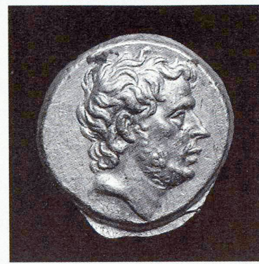
T. Quinctius Flamininus, statère d'or, Grèce, 196 avant JC