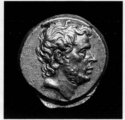
T. Quinctius Flamininus, statère d'or, Grèce, 196 avant JC

TRADART GENEVE SA 2, rue du Puits-St-Pierre - 1204 Genève Tél. +41 22 817 37 47 - Fax +41 22 817 37 48 e-mail : tradart.rp@tradart.ch