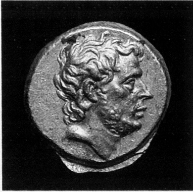
T. Quinctius Flamininus, statère d'or, Grèce, 196 avant JC