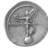
Octavian (43–27 v.Chr.), Denar (ca. 32–29 v.Chr.). Rs. CAESAR DIVI F, Victoria auf Globus, hält Lorbeer und Palmzweig. – Münzkabinett Winterthur, Inv. R 126.