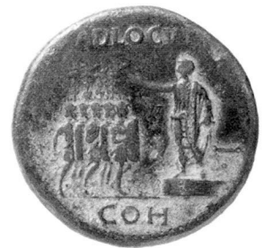
Caligula (37–41), Sesterz (40/41). Rs. ADLOCVT COH, Caligula mit Toga, eine Truppenansprache haltend. – Münzkabinett Winterthur, Inv. R 336.