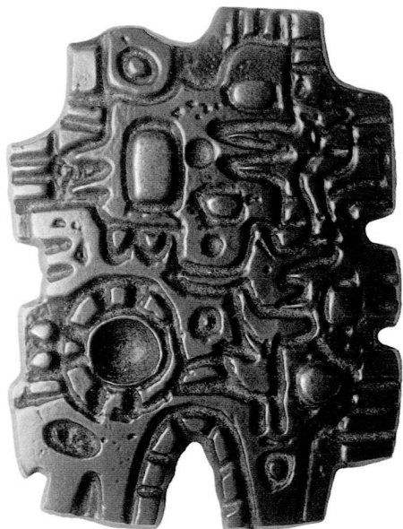
Ugo Crivelli, Songes, 1982.