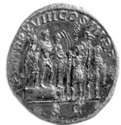
Septimius Severus (193–211), Sesterz (210). Rs. Septimius Severus mit Caracalla und Geta auf einer Plattform, eine Soldatenansprache haltend. – Münzkabinett Winterthur, Inv. R 2098.