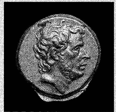
T. Quinctius Flaminius, statère d'or, Grèce, 196 avant JC